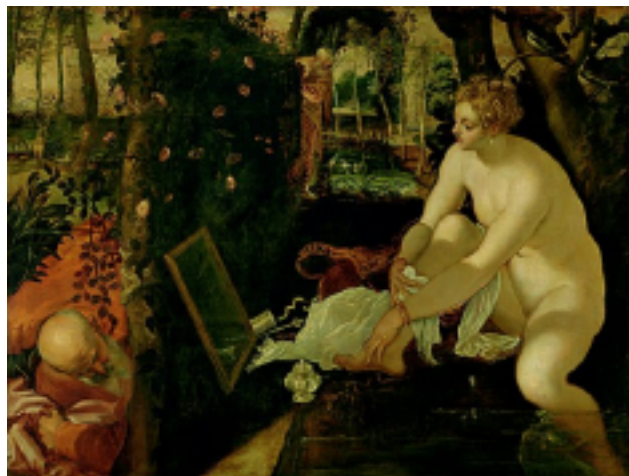
Véronèse Suzanne et les vieillards Paris, musée du Louvre