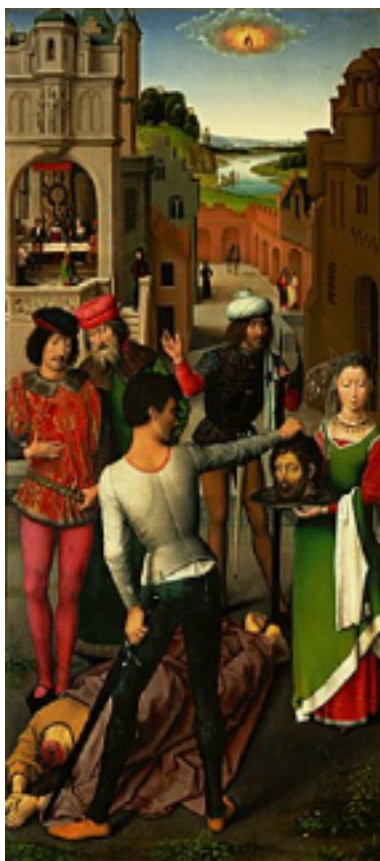
Memling Le Martyre de Jean le Baptiste Bruges, Memlingmuseum, Sint-Janshospitaal