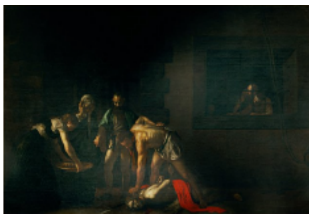
Caravage La Décapitation de saint Jean le Baptiste La Valette, cathédrale Saint-Jean