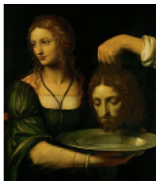
Luini Salomé recevant la tête de saint Jean-Baptiste Paris, musée du Louvre