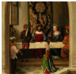
Le Martyre de Jean le Baptiste (détail : le banquet d'Hérode) (détail : Salomé)